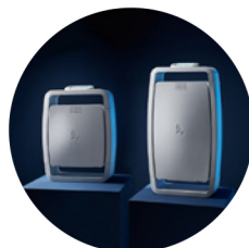
EOLIS Air Manager

Particules fines, COV, micr-organismes Intelligence embarquée