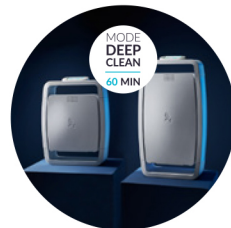
EOLIS Air Manager S